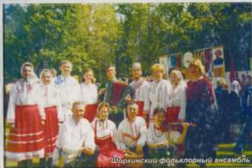
Шоркинский фольклорный ансамбль