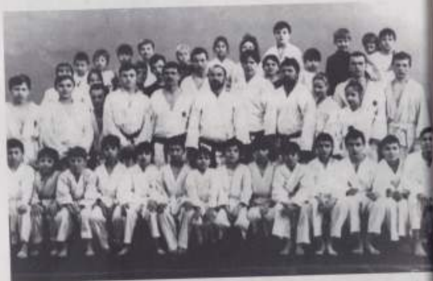
Каратисты клуба "Фудокан", г. Чебоксары, 1992 г.