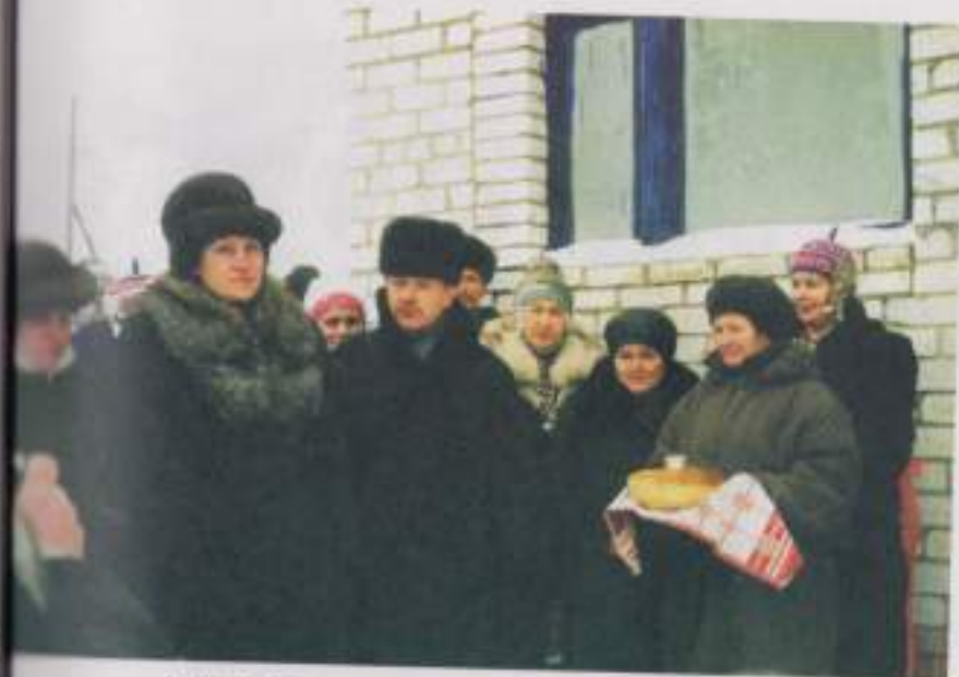
На открытии нового Шоркинского клуба. 11 января 2004 г.

С января по апрель 1942 года по зимней ладожской дороге было вывезено 514069 человек. Бомбы и пули фашистских