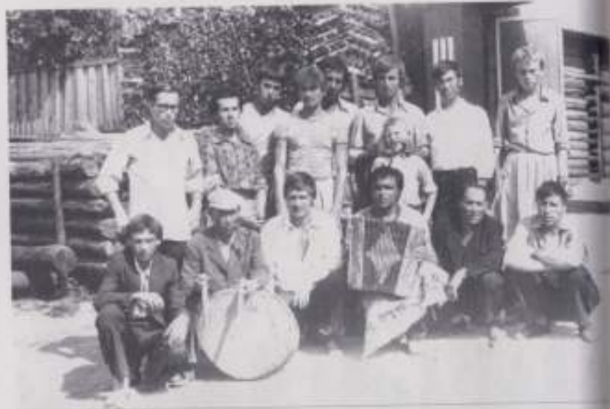
Жители д. Самуково, 1978 г.