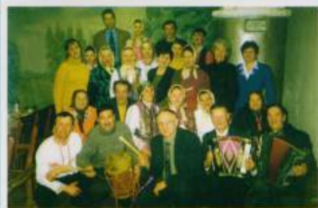
Жители д. Шоркино. Ноябрь, 2002 г.