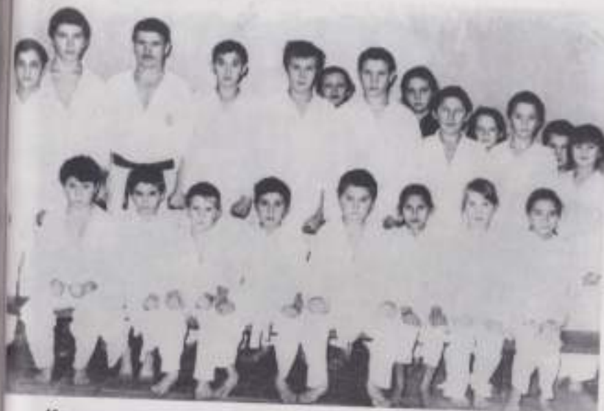
Каратисты Сятра-Хочехматской школы, 1993 г.

Ҷавәнна элпир Кушкә яләнче икүдән 3-мешәнче 8 сәхет те 36 минутра сирәнне тел пулма хавас.