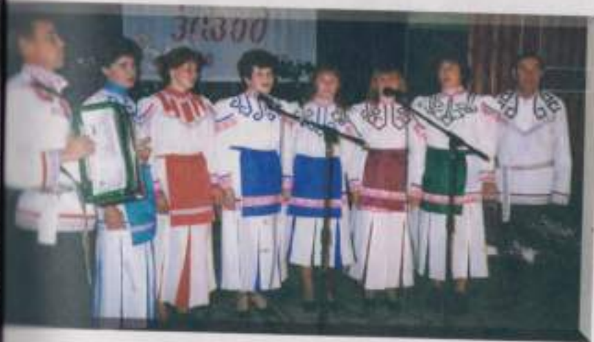
Артисты Ишлейского кирпичного завода. Октябрь, 2003 г.