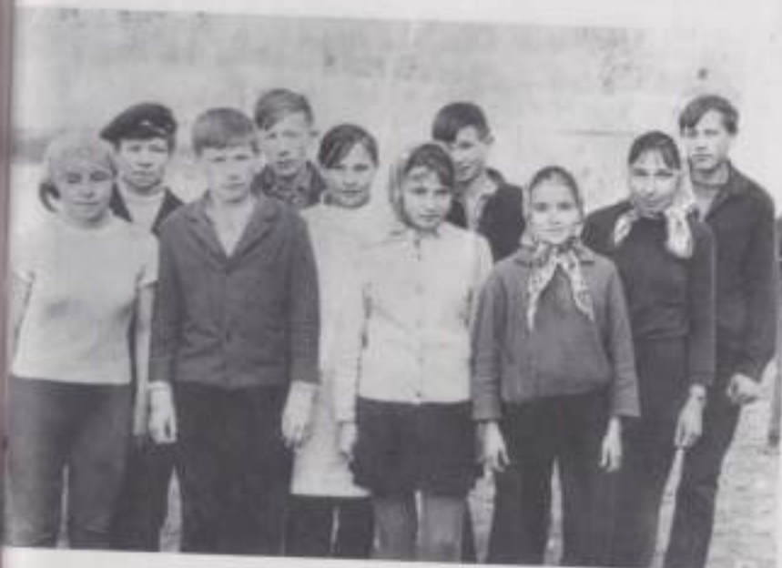
Победители эстафетного забега, с. Икково. 12 мая 1970 г.