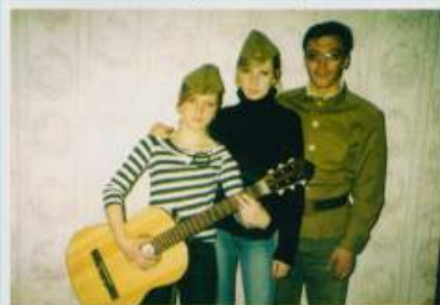
Артисты Шоркинского ансамбля. 9 мая 2004 г.