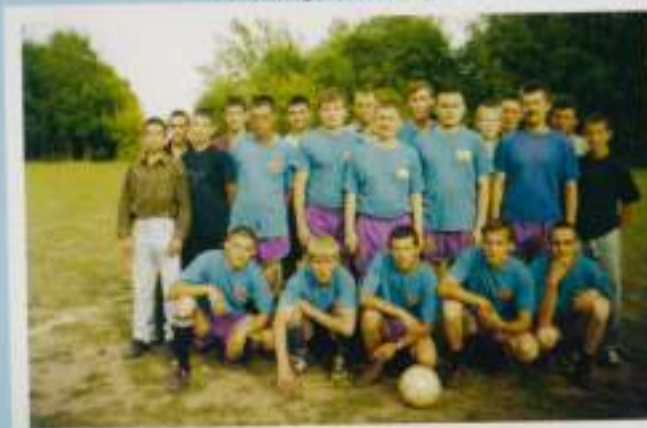
Футболисты Ишлейского кирпичного завода. Июль, 2002 г.