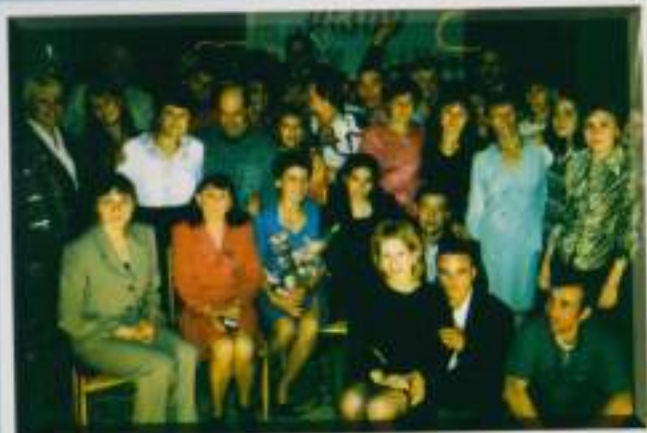
Коллектив Ишлейского кирпичного завода. Октябрь, 2003 г.