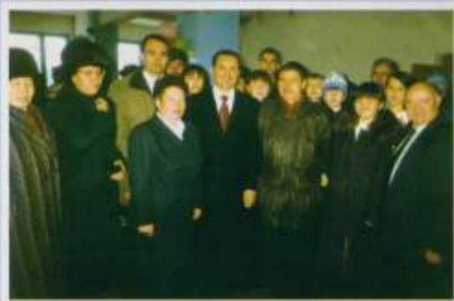
Президент Чувашии 17 ноября 2001 г. на открытии Икковской школы после реконструкции.